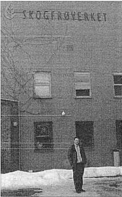
Fræbankinn er til húsa að Hamri í Austur-Noregi.